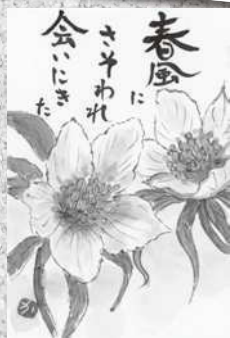
2019年絵手紙コンテスト 最優秀賞 田村かおりさん

日時●2月15日(土) 受付●13:00 13:30~15:00 講師●金山一宏さん(変更あり) 料金●500円 (カメラをご持参ください。)