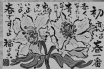
2017年絵手紙コンテスト 最優秀賞 向井喜八さん

日時●2月14日(水) 受付●13:00 13:30~15:00 講師●金山 一宏さん 料金●500円 (カメラをご持参ください。)